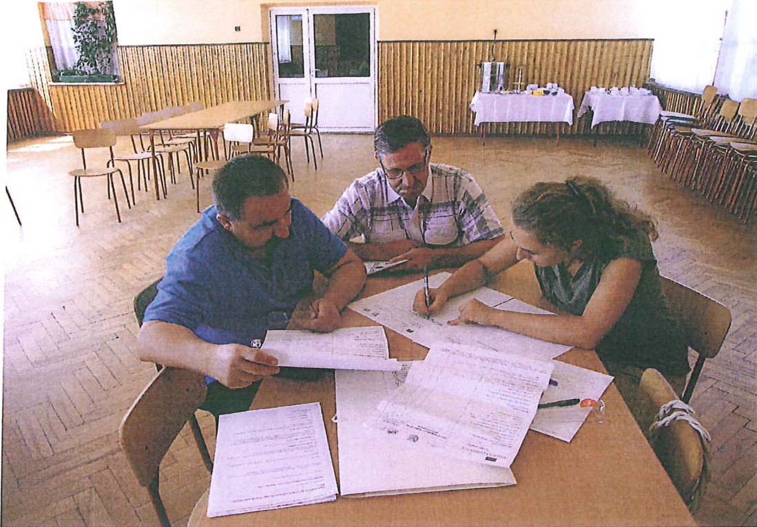
GOW z Markowej w czasie warsztatów

Szkolenie uzyskało wśród uczestników wysokie i bardzo wysokie oceny – średnia 4,7. Najlepiej oceniono ogólny poziom, atmosferę i relacje między uczestnikami i trenerami oraz przygotowanie trenerów.