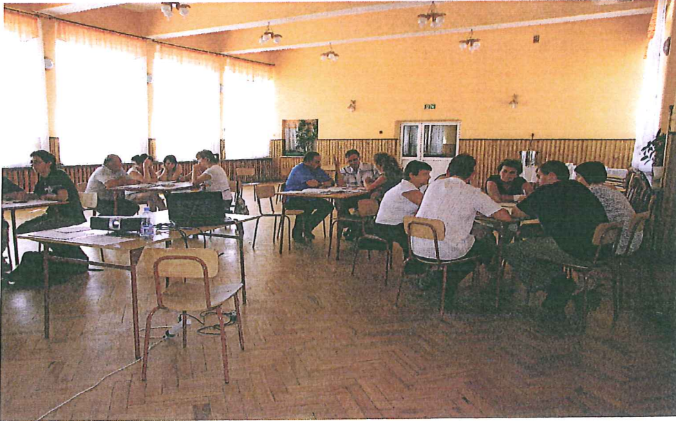
Sala GOK w Kańczudze.

Markowa wieś zachowująca tradycyjne elementy architektury i osadnictwa, kultywująca tożsamość lokalną i wartości życia wiejskiego, dbająca o zintegrowanych wokół lokalnych tradycji i obyczajów mieszkańców.