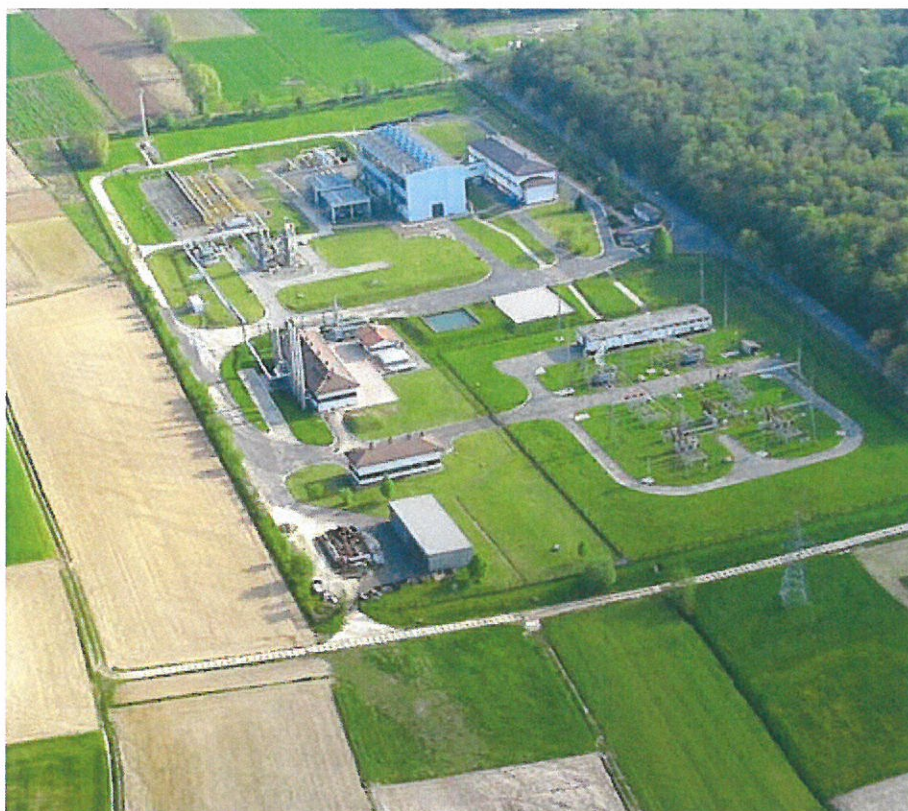
Magazyn gazu w Husowie