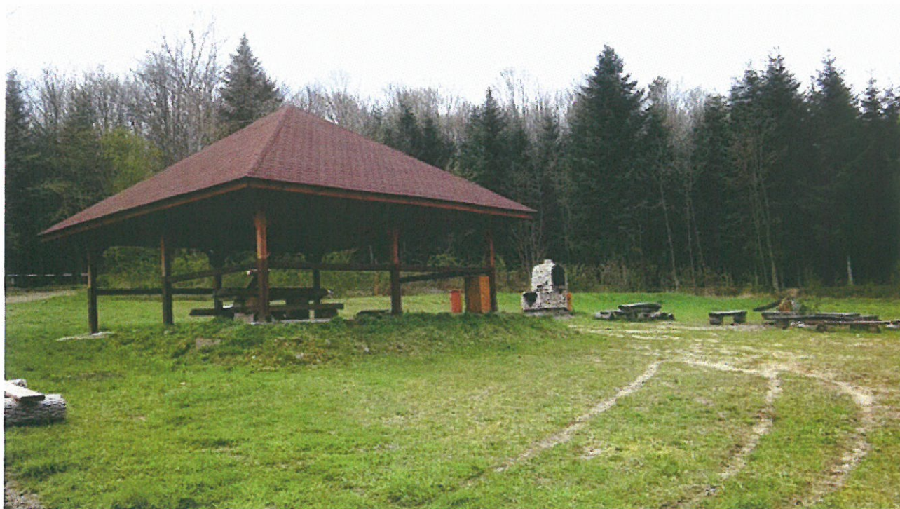
Teren rekreacyjny – Strasznik w Husowie