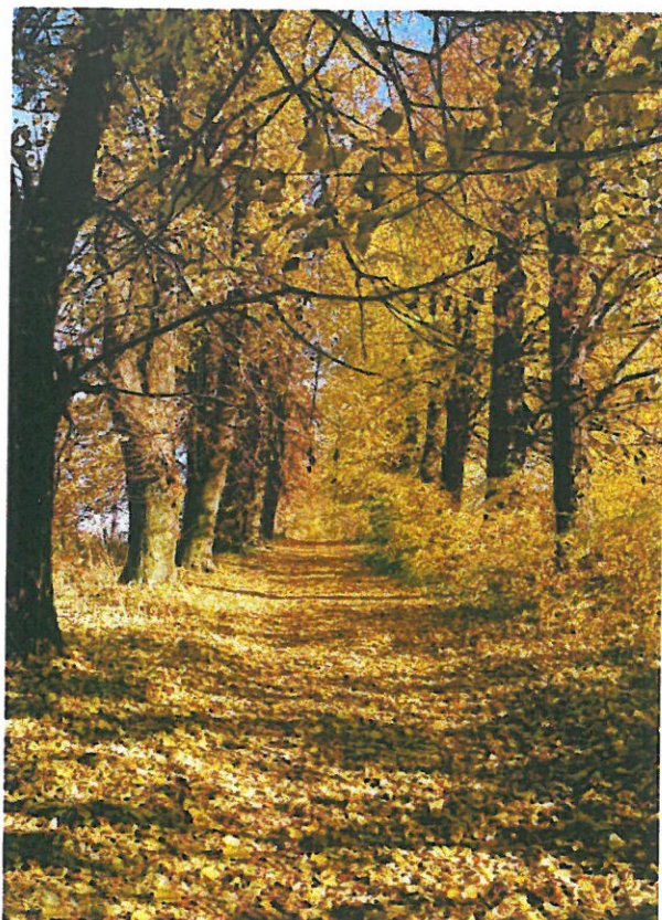
Aleja lipowa prowadząca do Parku Podworskiego