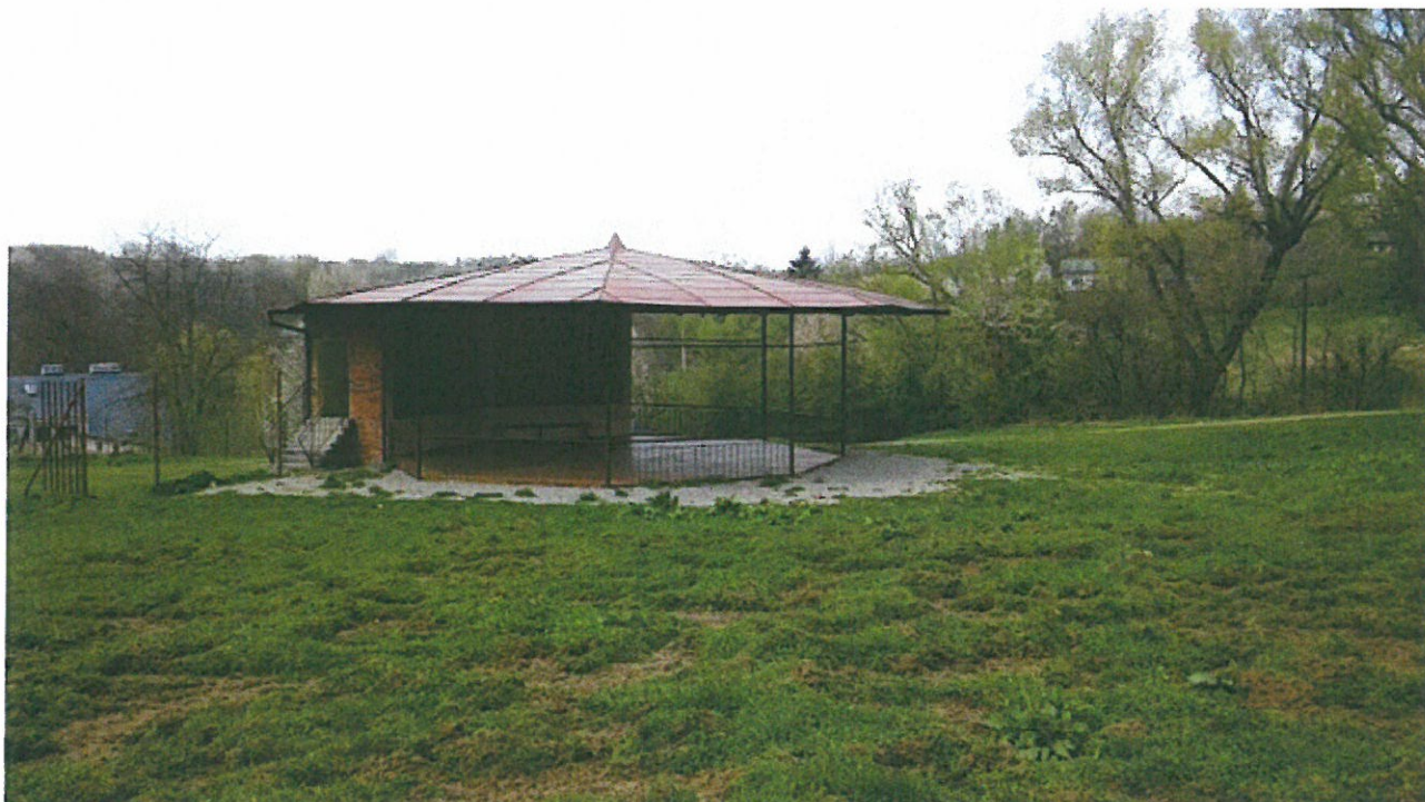
Grzybek w Husowie