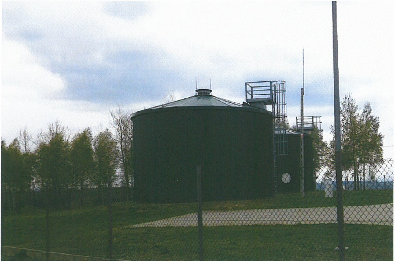
Zbiorniki wody w Husowie