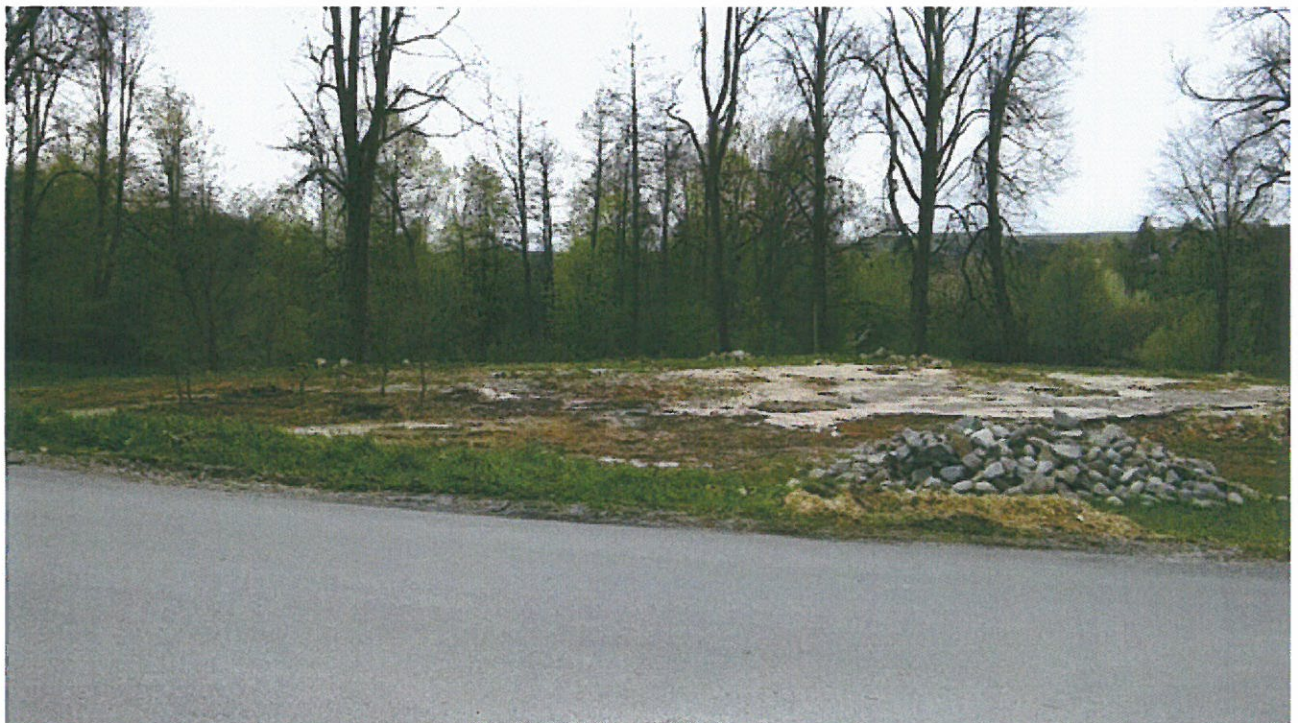
Plac po starym kościele w centrum wsi