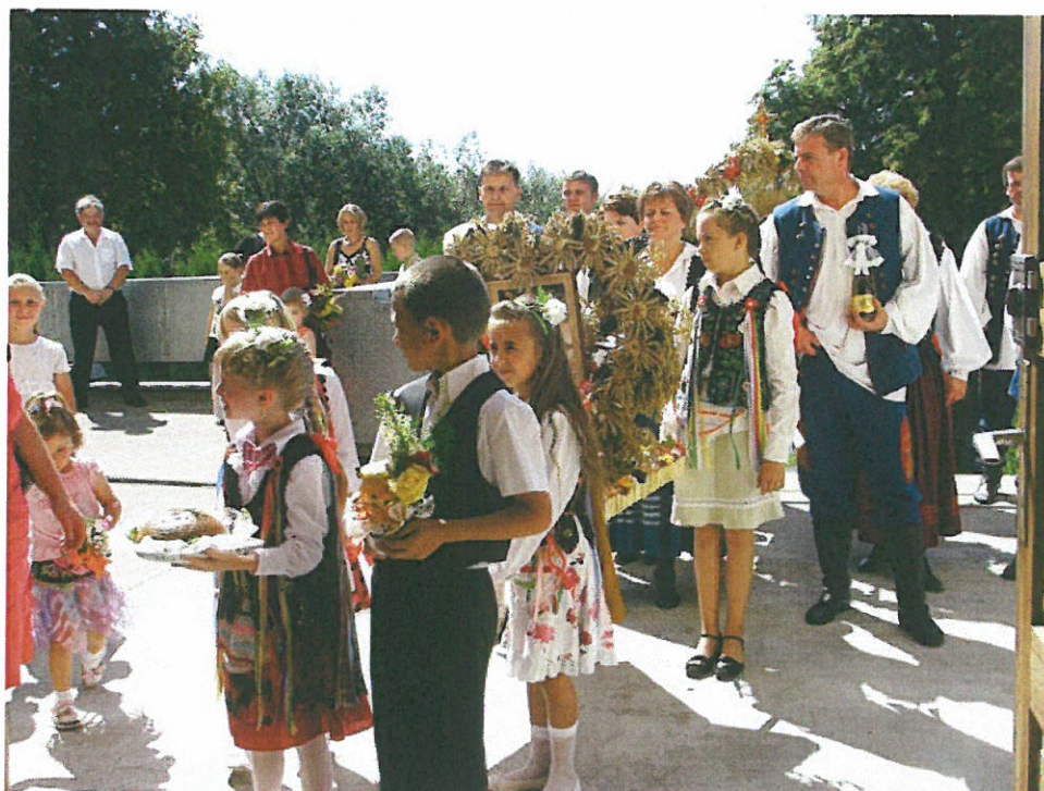
Fot. Małgorzata Kot