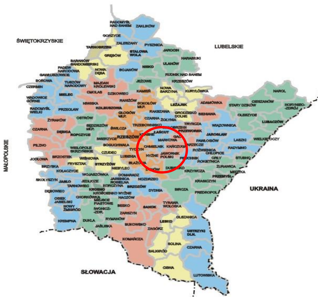
Rysunek.1 Mapa przedstawiająca położenie Gminy Markowa