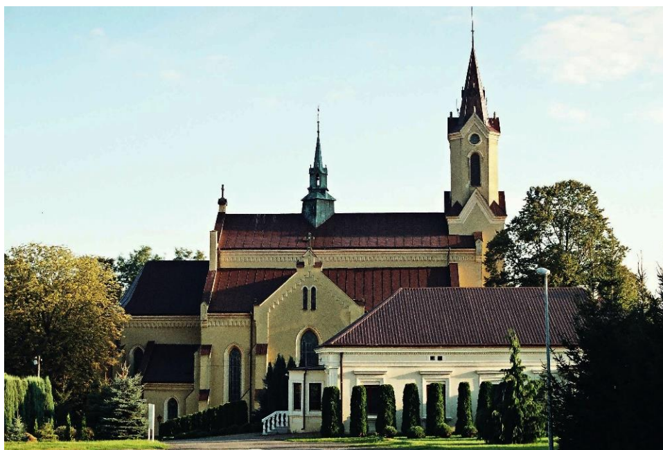
Rysunek 7. Zabytkowy Kościół pw. Św. Doroty w Markowej