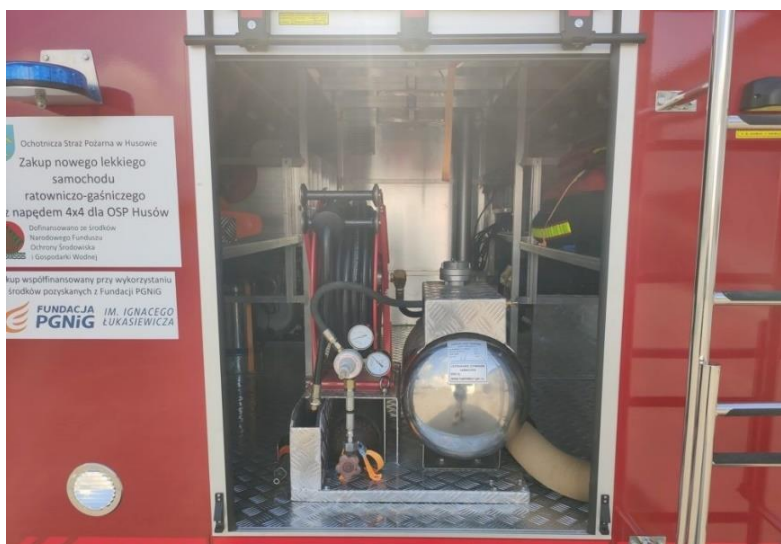
Tabela 49. Dotacje udzielone jednostkom OSP z budżetu gminy w 2019 roku na dofinansowanie zakupu sprzętu i wyposażenia