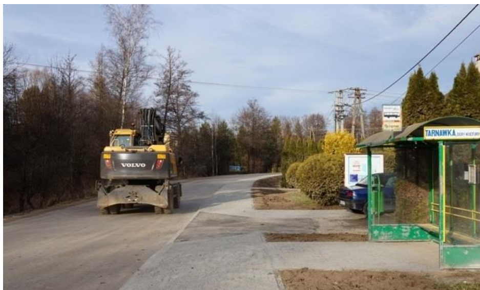
Rysunek 13. Przebudowa drogi powiatowej w Tarnawce