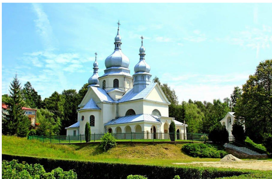
Rysunek 8. Kościół pw. Św. NMP w Tarnawce – dawna cerkiew