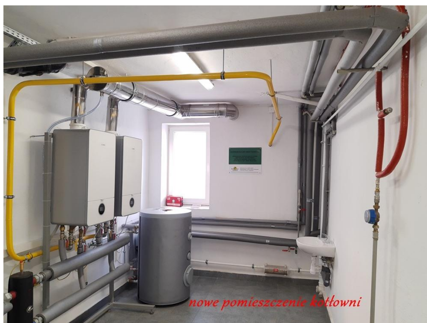
Rysunek 10. Przebudowa kotłowni w CKGM