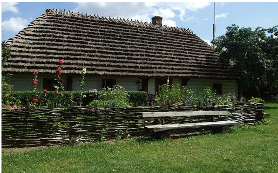
Rysunek 5. Skansen w Markowej