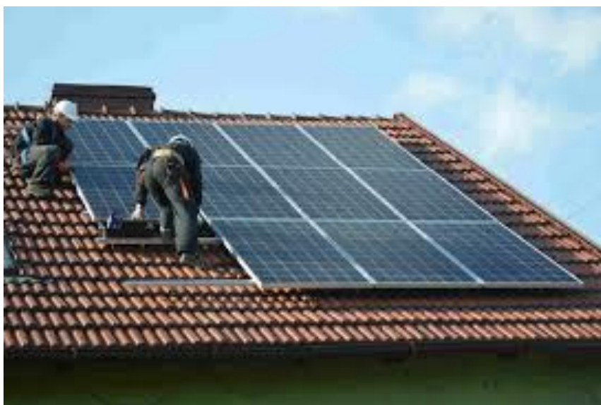
Rysunek 12. Montaż paneli fotowoltaicznych

W ramach powyższego zadania na terenie Gminy Markowa zamontowano na nieruchomościach osób fizycznych 113 instalacji fotowoltaicznych o mocy od 2 do 3 kW oraz 6 kotłów na biomasę o mocy 20 i 25 kW .