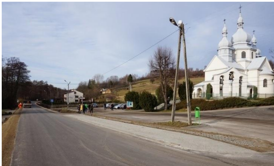
Rysunek 14. Zabezpieczenie osuwiska przy drodze gminnej w Husowie