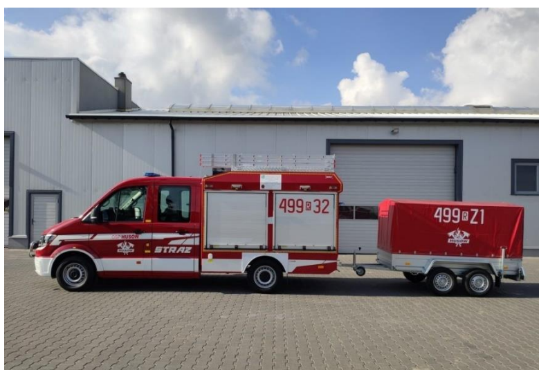
Rysunek 11. Nowy samochód lekki Volkswagen Crafter 35 4x4 dla jednostki OSP w Husowie

Uroczyste przekazanie samochodu wraz z wyposażeniem odbyło się w dniu 11 października 2019 r.