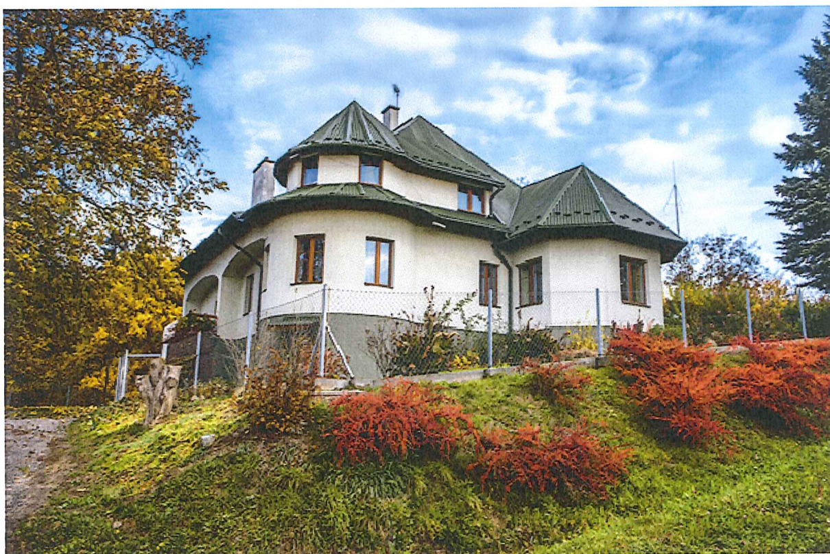
Leśniczówka – dawny pałacyk myśliwski