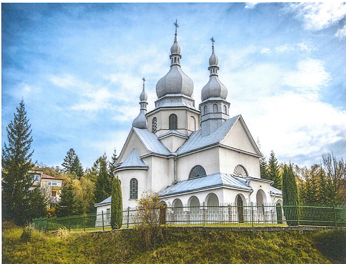
Kościół pw. Nawiedzenia NMP w Tarnawce