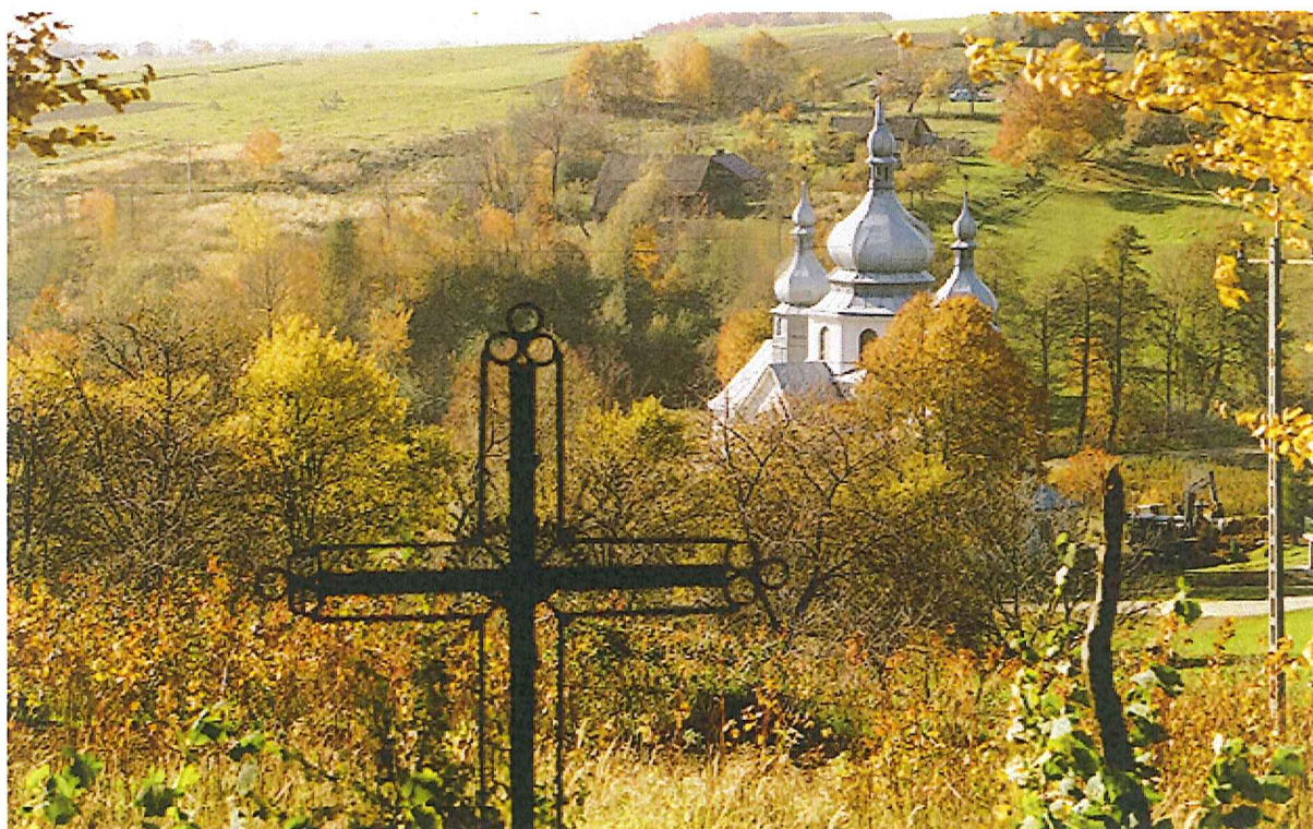
Panorama Tranawki- widok Kościoła pw. Nawiedzenia NMP