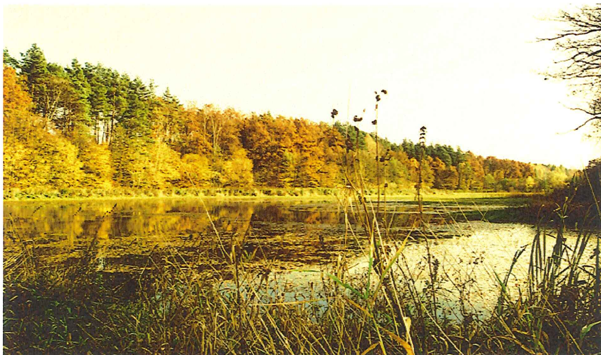
Tereny rekreacyjne- stawy w Tatnawce