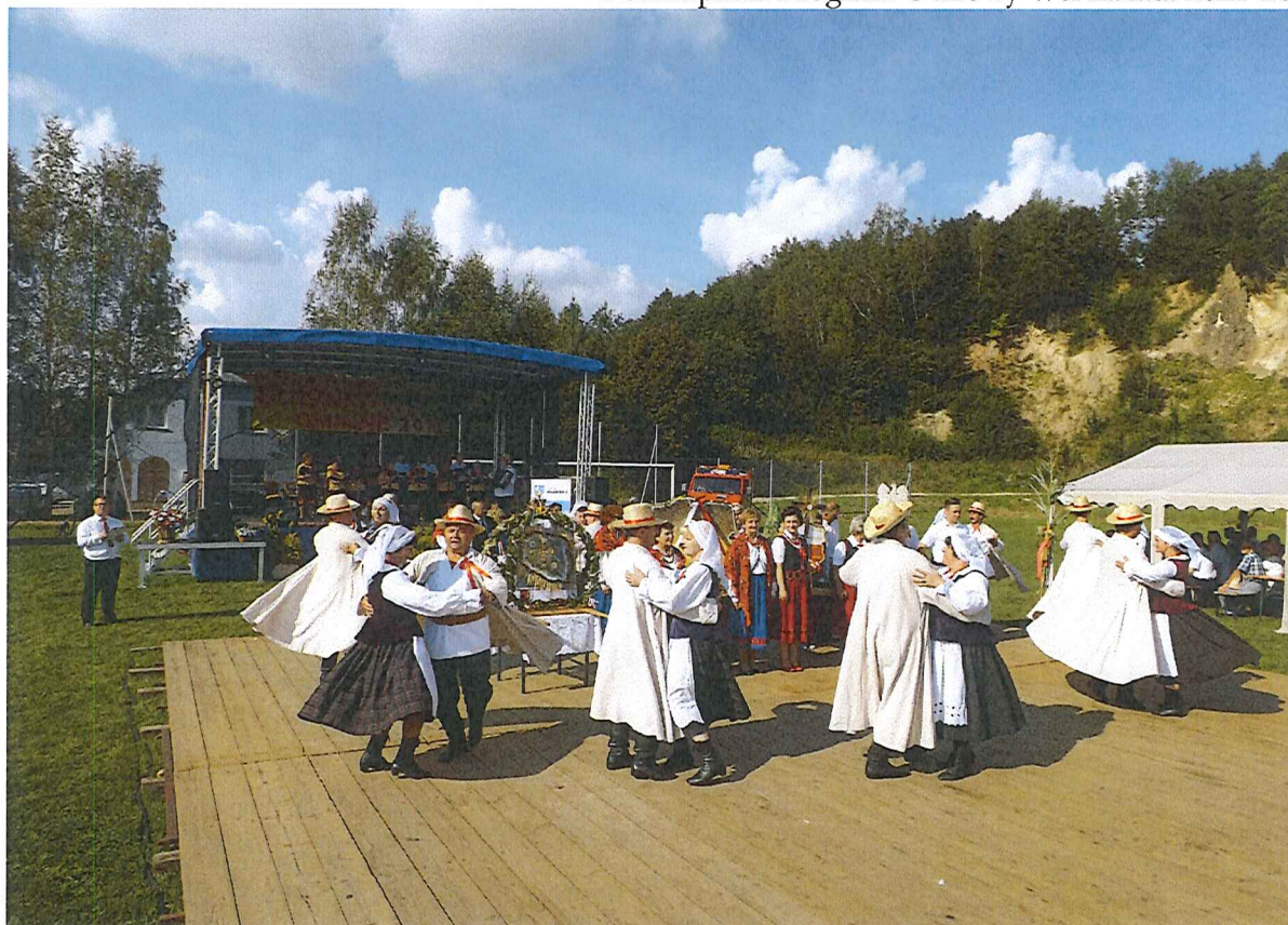
Dożynki gminne 2018–Tarnawka