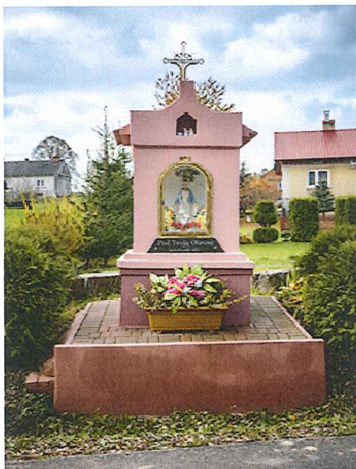
Zabytkowa kapliczka w Tarnawce, własność prywatna.