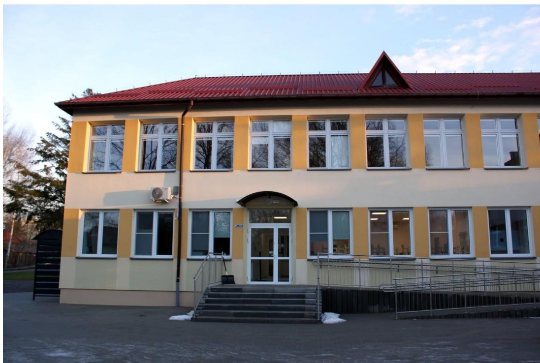
Rysunek 16. Żłobek w Markowej