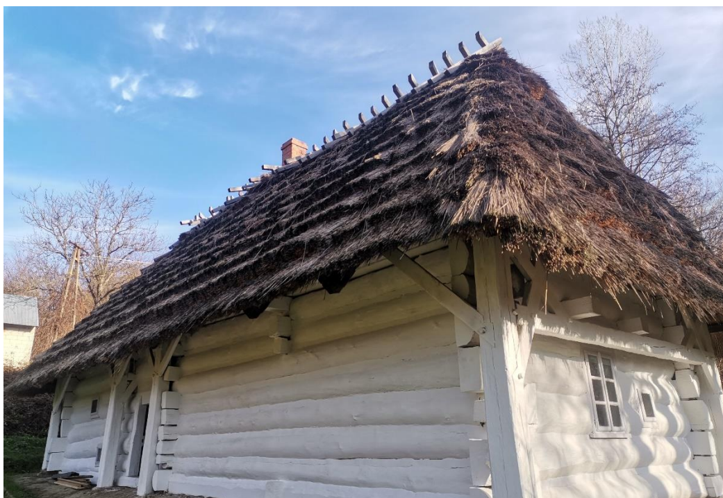
Rysunek 17. Remont Chaty Raka w Husowie