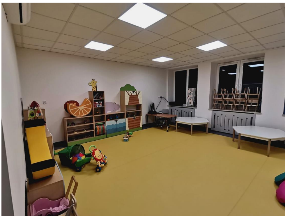
Rysunek 9. Żłobek w Markowej

W roku 2020 Gmina Markowa otrzymała dotację w ramach Programu MALUCH + na utworzenie pierwszego żłobka w Markowej. W roku 2020 przeprowadzono wszystkie prace budowlane i remontowe oraz zakupiono wyposażenie do placówki, przygotowano również strukturę organizacyjną i od 1 stycznia 2021 powołano Uchwałą Nr XXII/122/20 Rady Gminy Markowa z dnia 1 października 2020 r. nową jednostką organizacyjną Żłobek w Markowej.