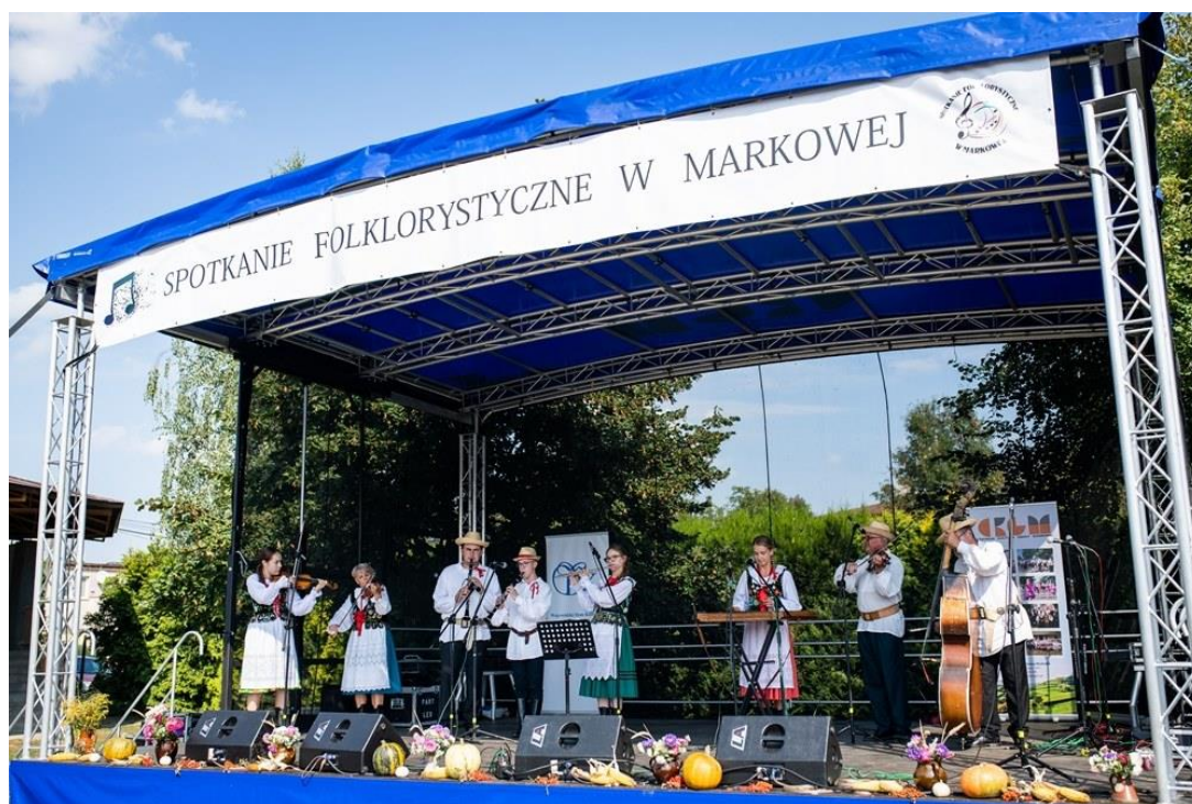
Rysunek 10. III Spotkanie Folklorystyczne w Markowej