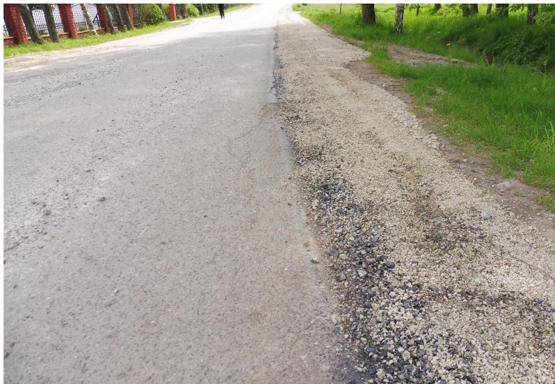
Rysunek 15. Przebudowa drogi „Zagumnia” w Markowej