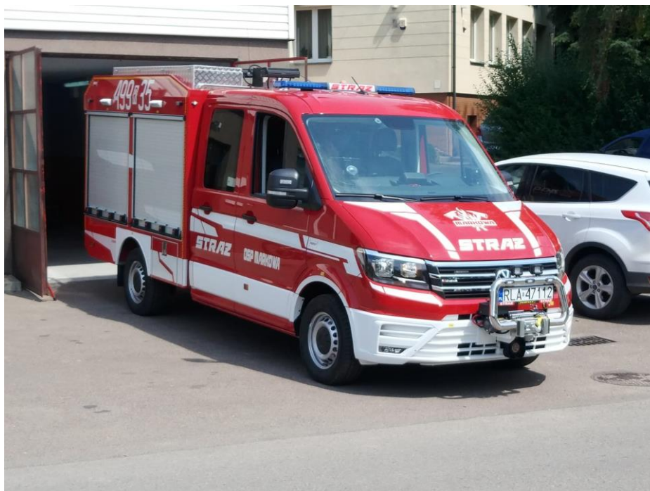
Rysunek 11. Nowy samochód lekki Volkswagen Crafter 35 4x4 dla jednostki OSP w Markowej