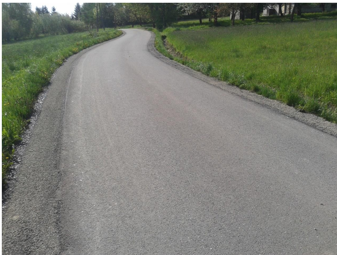
Rysunek 14. Przebudowa drogi „Mokrzanka” w Husowie