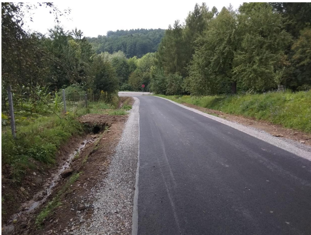
Rysunek 13. Przebudowa „Starej drogi” w Tarnawce