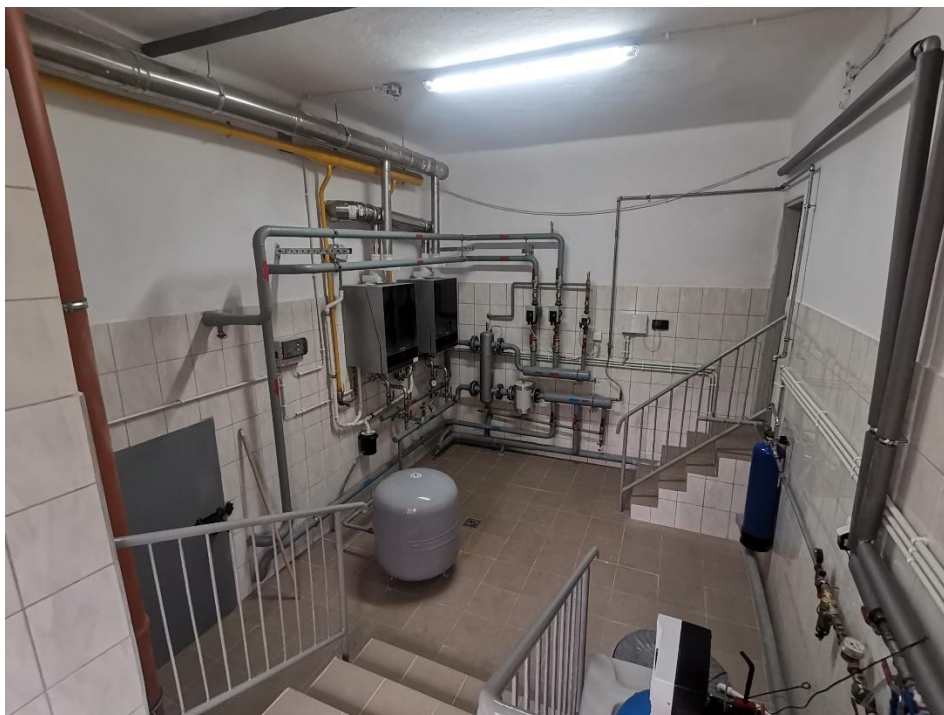
Rysunek 12. Przebudowana kotłownia w Urzędzie Gminy Markowa

W ramach realizacji Planu Gospodarki Niskoemisyjnej Gmina Markowa w roku 2020 realizowała zadania z zakresu wymiany źródeł ciepła w gminnych budynkach użyteczności publicznej. Zrealizowano zadanie pn. „ Przebudowa kotłowni węglowej na gazową w budynku Opieki Zdrowotnej w Markowej oraz budowa wewnętrznej instalacji gazowej ” oraz zadanie pn. „ Przebudowa kotłowni w budynku Urzędu Gminy w Markowej wraz z wykonaniem instalacji gazowej zasilającej kotłownię ” dofinansowane w ramach Funduszu Przeciwdziałania COVID-19 dla jednostek samorządu terytorialnego (Rządowy Fundusz Inwestycji Lokalnych). Wartość robót wyniosła łącznie 322.743,15 zł , całość kwoty pochodziła z dofinansowania.