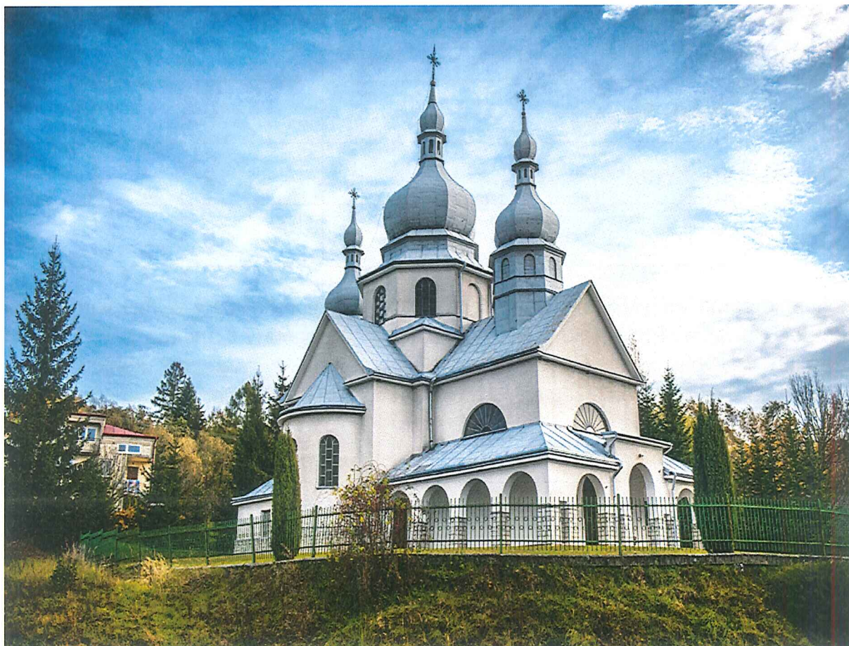
Kościół pw. Nawiedzenia NMP w Tarnawce