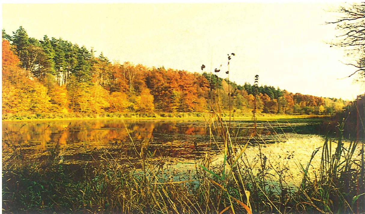
Tereny rekreacyjne- stawy w Tatnawce