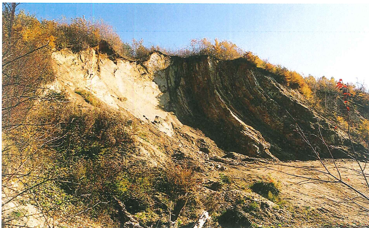
Nieczynny kamieniołom w Tarnawce