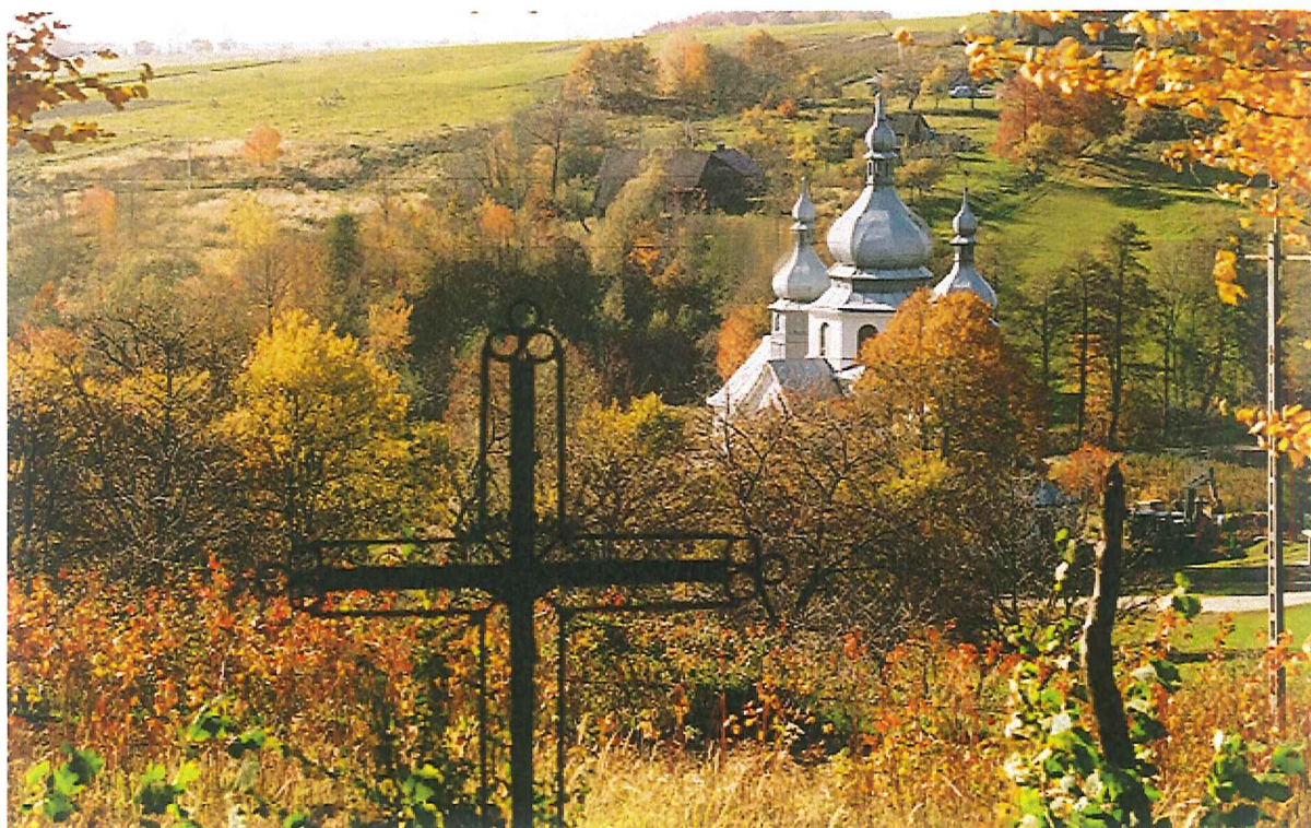
Panorama Tranawki- widok Kościoła pw. Nawiedzenia NMP