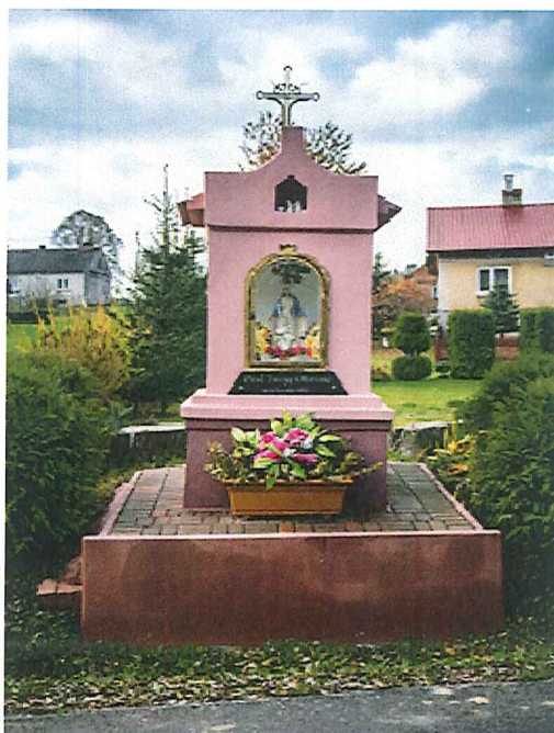
Zabytkowa kapliczka w Tarnawce, własność prywatna.