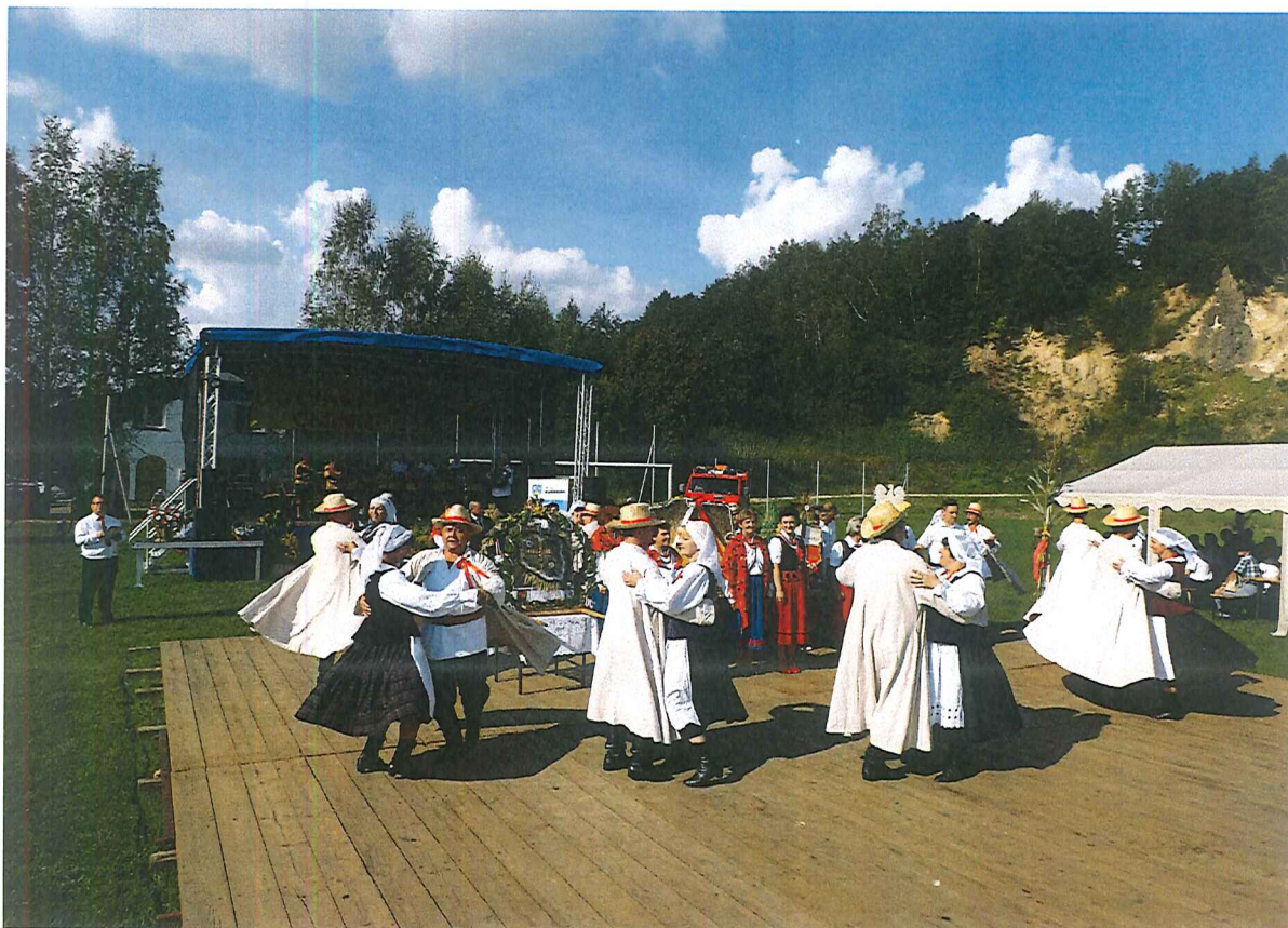
Dożynki gminne 2018–Tarnawka