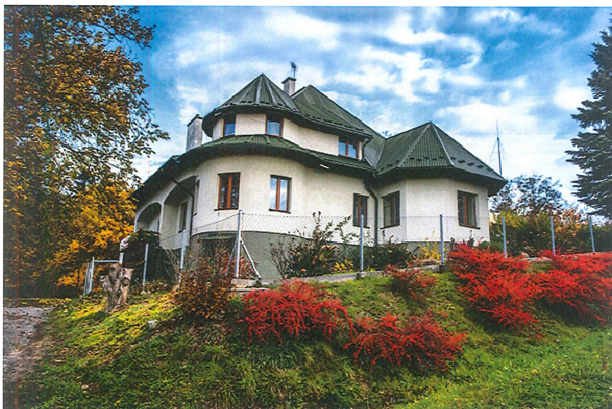
Leśniczówka – dawny pałacyk myśliwski